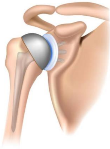
Figuur 2: totale schouderprothese

De orthopedisch chirurg maakt een snede aan de voorkant van uw schouder. Vervolgens wordt het gewrichtskapsel opengemaakt om de kop uit de kom te kunnen halen. De schouderkop wordt deels verwijderd, waarna de schouderprothese kan worden geplaatst (zie figuur 2). De kop wordt vervangen door een metalen bol die met een steel wordt vastgezet in het bot van de bovenarm. Het tweede deel is een kom van gehard plastic (polyethyleen). De kop past precies in de nieuwe schouderkom, waardoor de schouder weer soepel kan bewegen. De structuren rondom de nieuwe schouder, zoals pezen, spieren en kapsel worden gespaard. Deze zijn van groot belang voor het uiteindelijke functioneren van het gewricht. Om de schouderprothese te kunnen plaatsen moet de spier aan de voorzijde worden losgehaald en aan het einde van de operatie weer vastgemaakt.