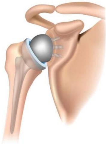
Figuur 3: omgekeerde schouderprothese

Als er naast de slijtage van de schouder ook een onherstelbare peesscheur bestaat, kan de orthopedisch chirurg kiezen voor een omgekeerde schouderprothese. Dit is een aangepast type schouderprothese waarbij de delen omgekeerd geplaatst worden. Dit wil zeggen dat de nieuwe schouderkop wordt geplaatst op de plaats waar voorheen de schouderkom zat. De nieuwe schouderkom wordt geplaatst op de plaats waar voorheen de schouderkop zat (zie figuur 3). De omgekeerde schouderprothese functioneert dan met behulp van de kracht van de grote, oppervlakkig gelegen schouderspier. Dit herstelt meestal (gedeeltelijk) de kracht en functie van de schouder.